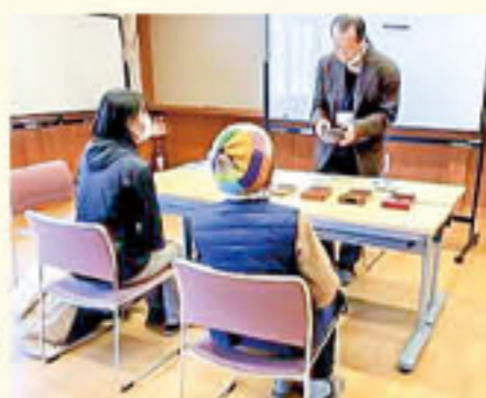
カリンバ隊の様子 (2月撮影)

山中湖情報創造館で毎月第三土曜日14:30から開催しておりますカリンバ隊は、アフリカに伝わるカリンバという珍しい楽器を使って音楽を奏でる、初心者向けの講習会です。参加費無料、飛び入り参加歓迎。大人も子どもも気軽に覚えることのできるカリンバで、音楽を奏でてみませんか?